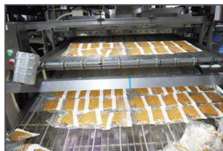
実際の設置後イメージ