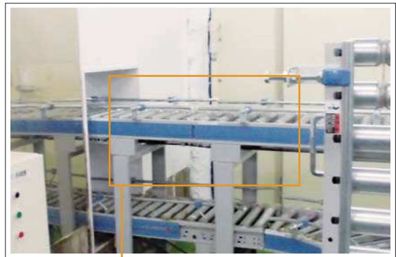
新しいローラーコンベヤに改良。