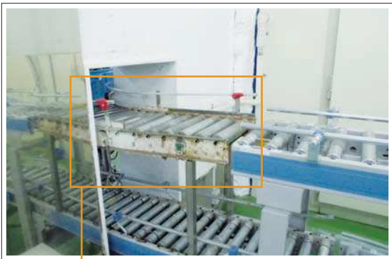
老朽化が進んでいたローラーコンベヤ。